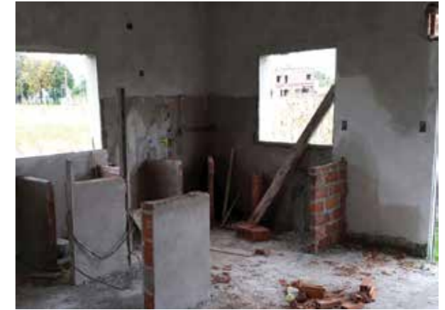
Beneficiarios del plan Procrear muestran las condiciones de las obras (4)

Algunas de las problemáticas que los beneficiarios vienen afrontando son: