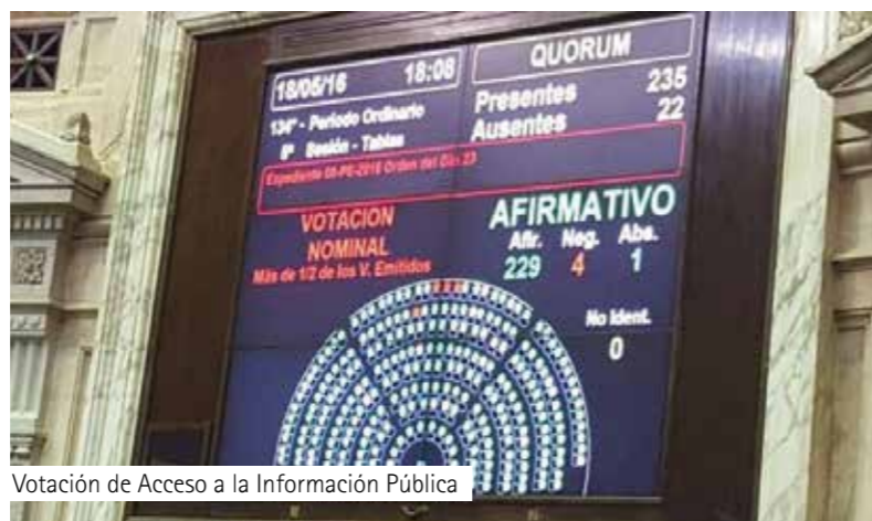
Votación de Acceso a la Información Pública

La iniciativa consiguió un apoyo casi unánime en el recinto, al sumar 229 votos a favor y sólo cuatro en contra de los diputados de izquierda y una abstención del legislador kirchnerista Julio Solanas.