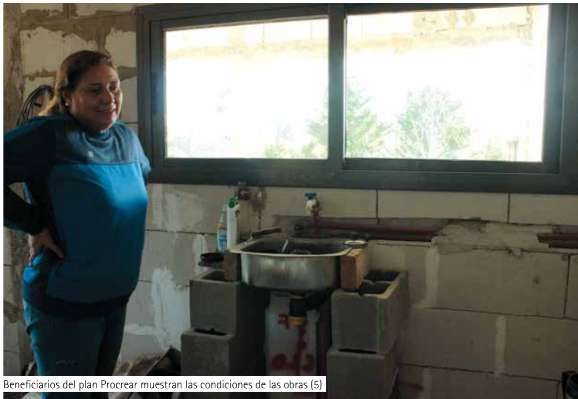
Beneficiarios del plan Procrear muestran las condiciones de las obras (5)

Esta situación se repite en todo el país, en Santa Fé, en Paraná, en Salta, en varias ciudades de la Patagonia, en localidades de la provincia de Buenos Aires, etc. En varios de esos rincones del país, los beneficiarios se juntaron primero por redes sociales, y después personalmente. Constataron que su problemática se repite en diferentes regiones, casi con las mismas características. Préstamos que se otorgaron en tiempo y en forma, no alcanzaban y con el pasar del tiempo, debieron endeudarse aún más para poder lograr cumplir los plazos de la obra.