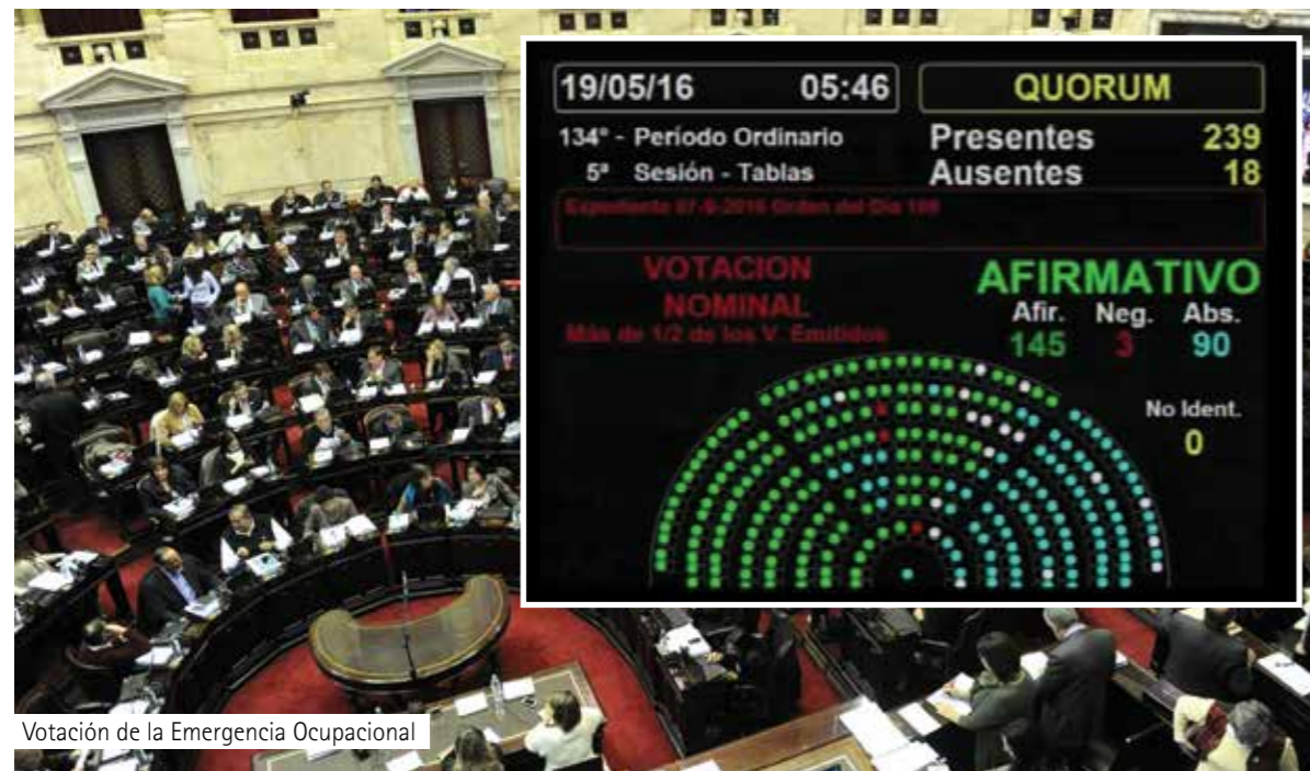
Votación de la Emergencia Ocupacional

El Congreso, al igual que los sindicatos, ayudado por el frío de invierno, parece aplacar un debate que se mantuvo encendido durante meses. El rigor de las propuestas, como modas, se tapan unas a otras. •