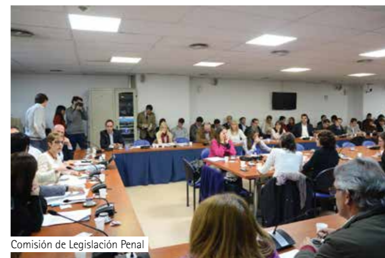
Comisión de Legislación Penal