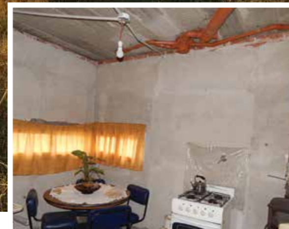
Beneficiarios del plan Procrear muestran las condiciones de las obras (2)

6) Y en los últimos días, como consecuencia de la variación de los costos de la construcción –por las causales ya expresadas– el Banco Hipotecario ha advertido a quienes están por presentar o presentaron recientemente su carpeta, que deben modificar el costo del m 2 de construcción llevando el tope de $7500 a $9500, por lo que el monto máximo que otorga el Pro.Cre.Ar de $520.000 sólo alcanzaría para construir una vivienda de 54 m 2 .