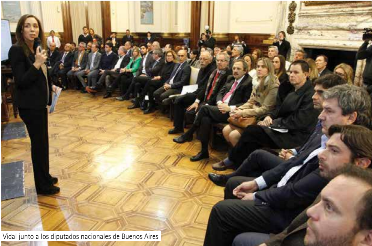
Vidal junto a los diputados nacionales de Buenos Aires

La gobernadora de la provincia de Buenos Aires, María Eugenia Vidal, envió una carta a Emilio Monzo (presidente de la Cámara de Diputados) para reunirse con los diputados nacionales de la Provincia de Buenos Aires en pos de establecer los mecanismos necesarios para “descongelar” el fondo del conurbano. Acompañada con jefes comunales, la gobernadora calificó como “una deuda de histórica de la democracia” el congelamiento del monto que recibe la provincia por el impuesto a las ganancias.