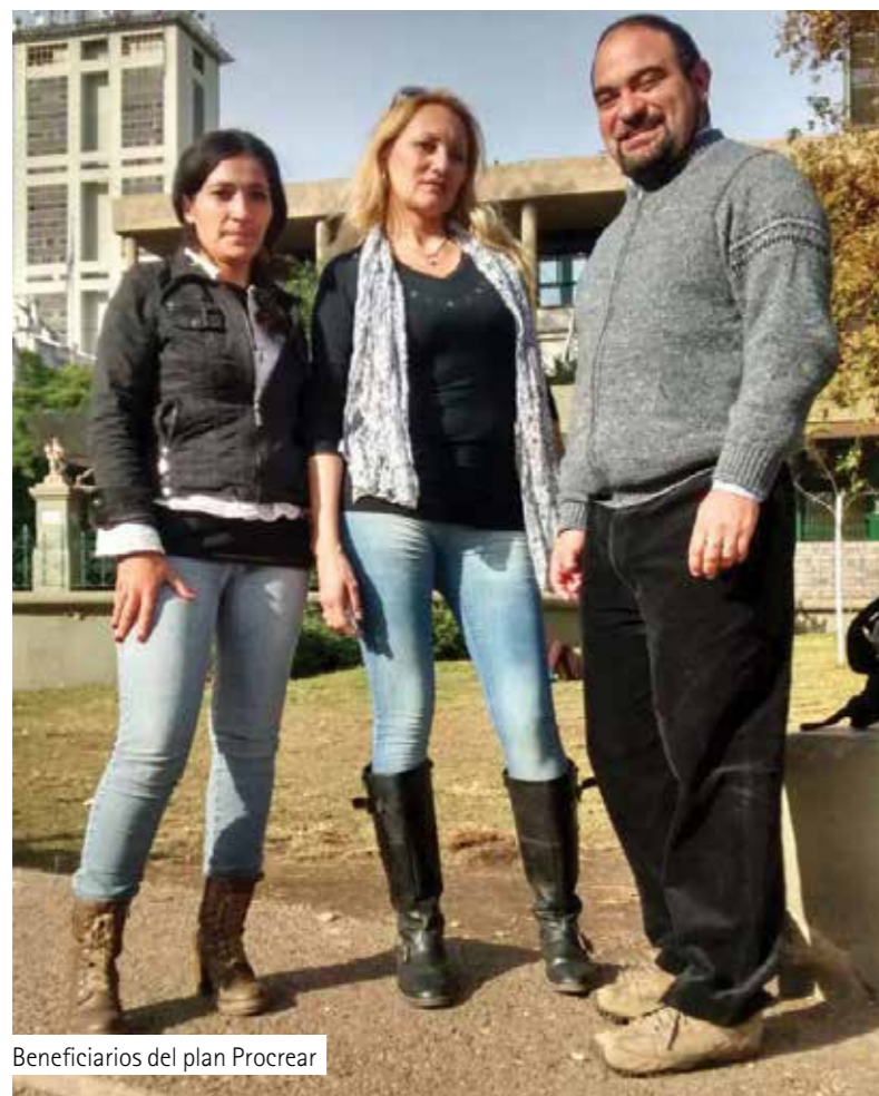
Beneficiarios del plan Procrear