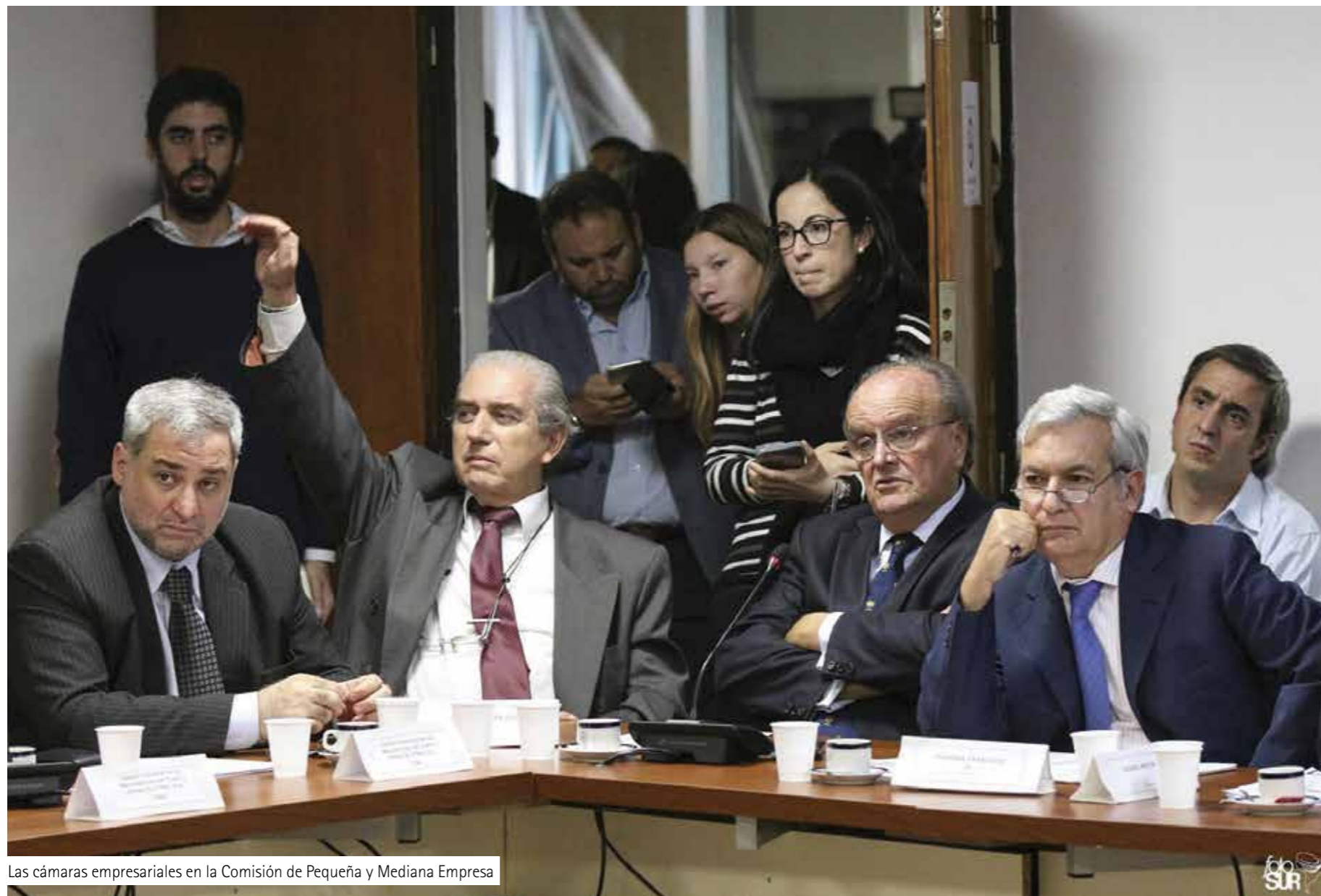
Las cámaras empresariales en la Comisión de Pequeña y Mediana Empresa

El proyecto del oficialismo firmado por los ministros de Producción, Francisco Cabrera, y de Hacienda y Finanzas Públicas, Alfonso Prat-Gay, y por el jefe de Gabinete, Marcos Peña, establece un régimen "de fomento para micro, pequeñas y medianas empresas que efectúen inversiones productivas" y un "tratamiento especial" para estas compañías en determinados impuestos".