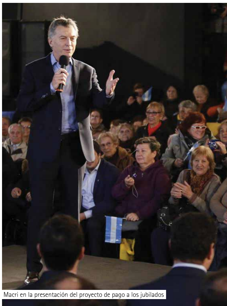
Macri en la presentación del proyecto de pago a los jubilados

Si bien políticamente puede ser beneficioso para levantar en algún punto los números del mercado interno y en el repunte de la imagen presidencial, sostienen que la principal razón es "para cumplir la ley".