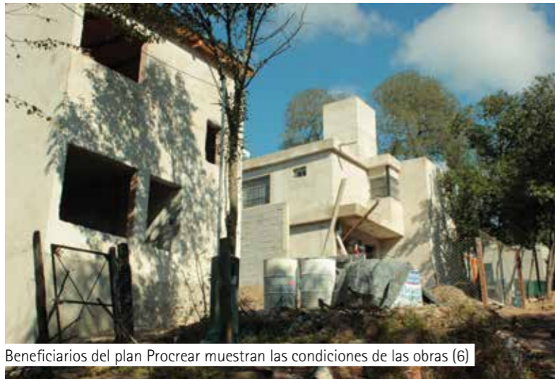
Beneficiarios del plan Procrear muestran las condiciones de las obras (6)