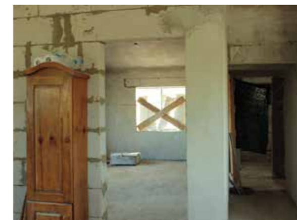
Beneficiarios del plan Procrear muestran las condiciones de las obras (3)