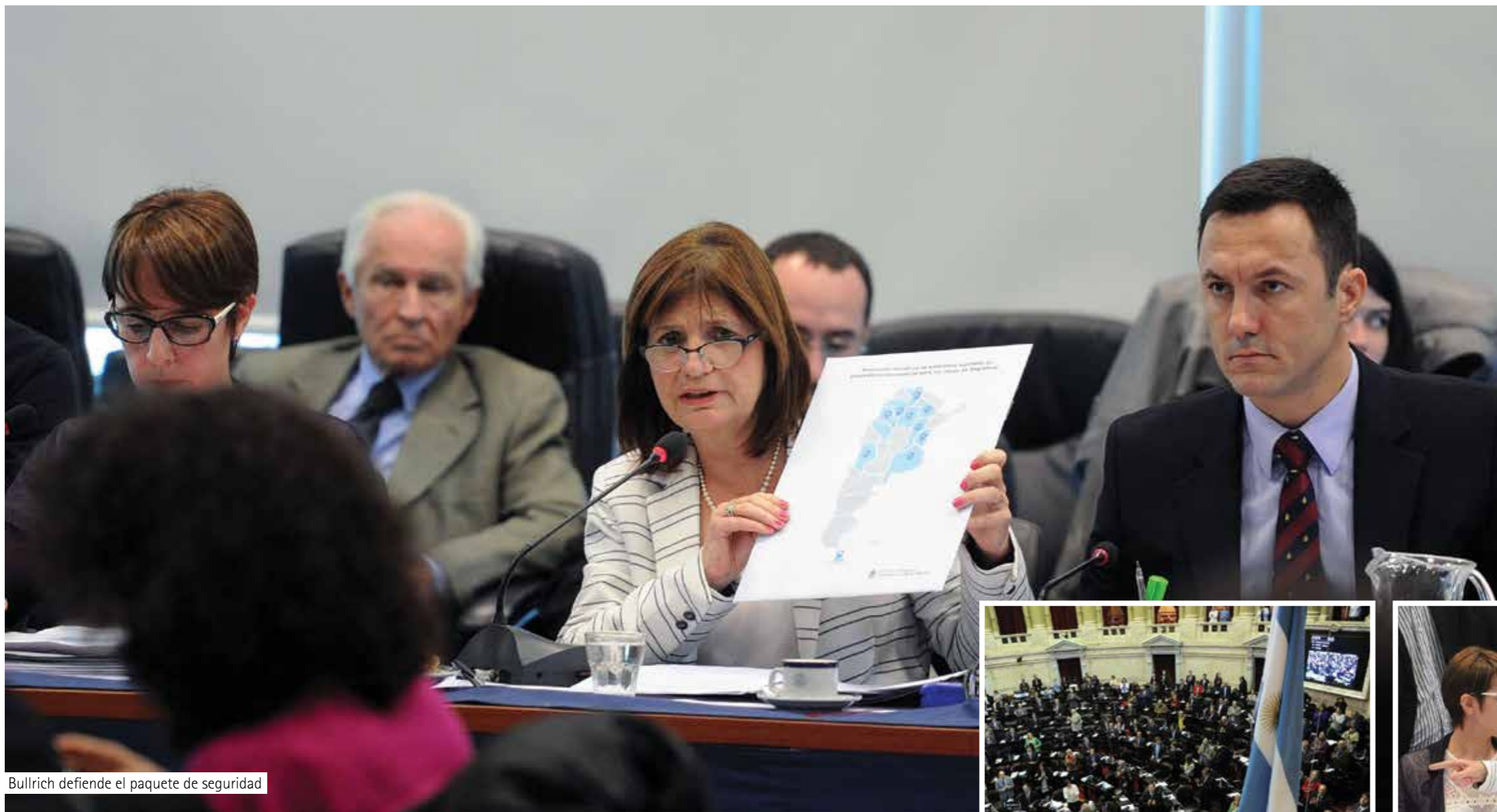
Bullrich defiende el paquete de seguridad