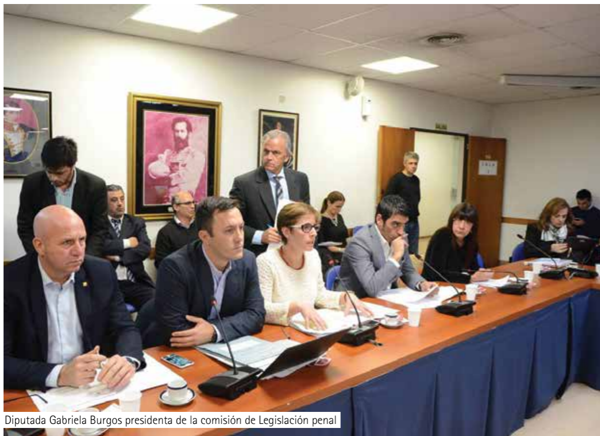
Diputada Gabriela Burgos presidenta de la comisión de Legislación penal