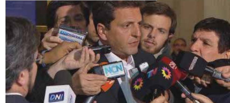
Massa en la votación de la Emergencia Ocupacional

El líder del Frente Renovador, Sergio Massa, estalló durante el debate por la Ley Antidespidos después de enterarse que el oficialismo se abstendría y le dejaría el camino allanado al kirchnerismo para promulgar la ley. Y así se lo hizo saber al jefe del interbloque Cambiemos, Mario Negri, con una dura frase: "Te diste vuelta como una media". La pelea se desató a raíz del cambio de estrategia del Poder Ejecutivo, que dejó de buscar consensos en el massismo porque optó por una rápida promulgación para después vetarla. El tigreño, que apoyaba reformas para incluir a las Pymes, se quedó con las manos vacías y le llevó el reproche a Negri.