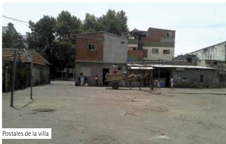
Postales de la villa

En cuanto al referido Plan Procrear de Barracas y Pompeya parece que los funcionarios nacionales no son conscientes que los terrenos donde están construyendo las viviendas están ubicados en plena Villa 21 y los vecinos los consideran propios.